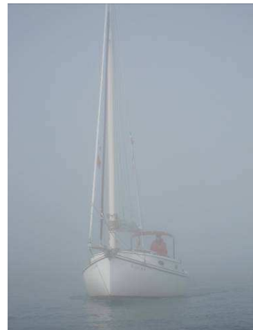
Half Moon nella nebbia

Bene, siamo giunti alla fine del bollettino, questo lo leggeremo il 26 novembre a Grado in occasione del nostro pranzo di Natale. Gli appuntamenti nautici comunque non finiscono. Meteo permettendo, c'è in previsione la "crociera dell'immacolata" 08 - 11 dicembre e... udite udite... l'ultimo dell'anno in barena con veleggiata il primo giorno del nuovo anno.