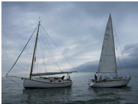
Temporali minacciosi alla partenza

Ventisei imbarcazioni erano presenti alla 1ª Regata del Solstizio, organizzata dal Diporto Velico Veneziano, solo 2 i cat presenti. Cassiopea ha raccolto la sfida di Mili che metteva in palio una bottiglia di vino. Per non essere da meno, Cassiopea ha messo in palio ben due bottiglie nel caso avesse perso. Purtroppo Cassiopea ha dovuto soccombere e “pagare” il prezzo pattuito. Ma veniamo alla regata. La partenza sotto temporali minacciosi ci ha costretti a dare due mani di terzaroli. Con quella velatura è stata un'impresa riuscire a doppiare la boa di