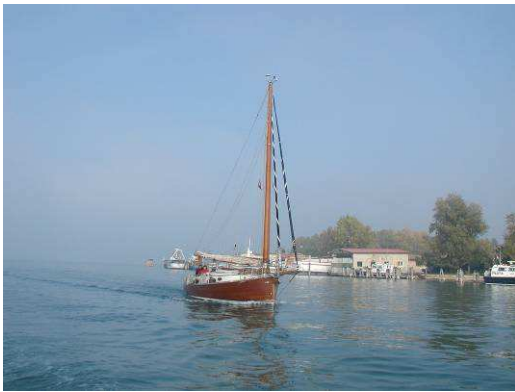
Mili un po' prima della nebbia