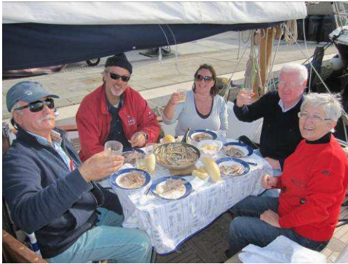
Cappe longhe e risi e zuca