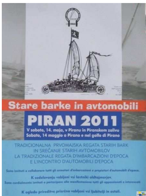
Il manifesto del raduno / regata