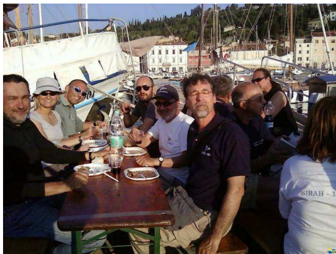
Le libagioni in banchina