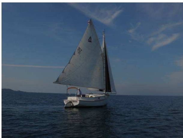
Half Moon con la nuova trinchettina