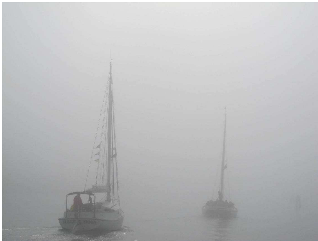
Half Moon e Cassiopea nella nebbia, alla “Crociera dei Santi”