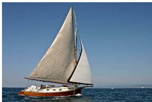
Mili in regata si nota appena la controranda