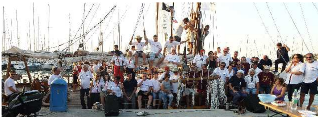
I partecipanti e gli organizzatori del raduno