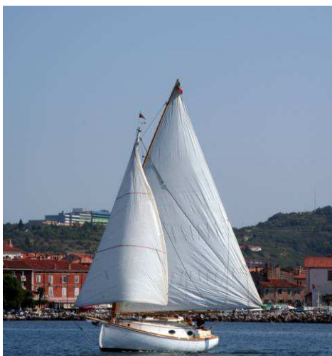
Cassiopea alla partenza