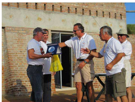
Cassiopea “paga pegno” a Mili

disimpegno, ovviamente di bolina, a questo si è aggiunto un mio errore di regolazione della randa che ci ha fatto perdere molta strada. In compenso una volta doppiata la boa ed aiutati da un discreto vento da Bora sono riusciti a recuperare molte posizioni su Mili che invece ha condotto una splendida regata. Spiegata tutta la velatura, mentre si doveva procedere a farfalla, il mio equipaggio