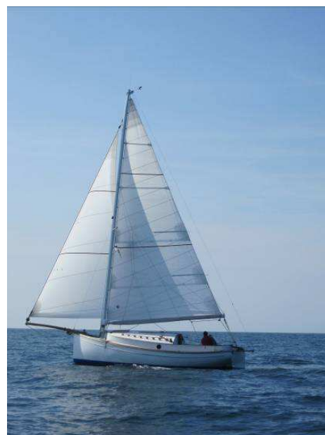
Pussycat con il nuovo armo